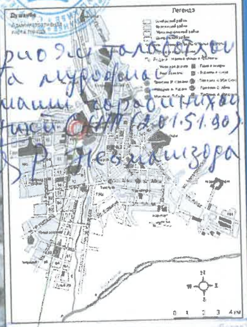
Тавзеҳоти нақшаи генералӣ